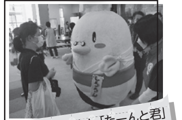
「しろろん」と「たーんと君」 が来てくれました♪