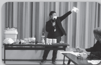
▲防災グッズにもなる商品を紹介

無印良品アスモ高山から講師を迎え、災害への備え方、防災グッズに関する情報を教えていただきました。また、災害時に役立つテント組立訓練も行いました。